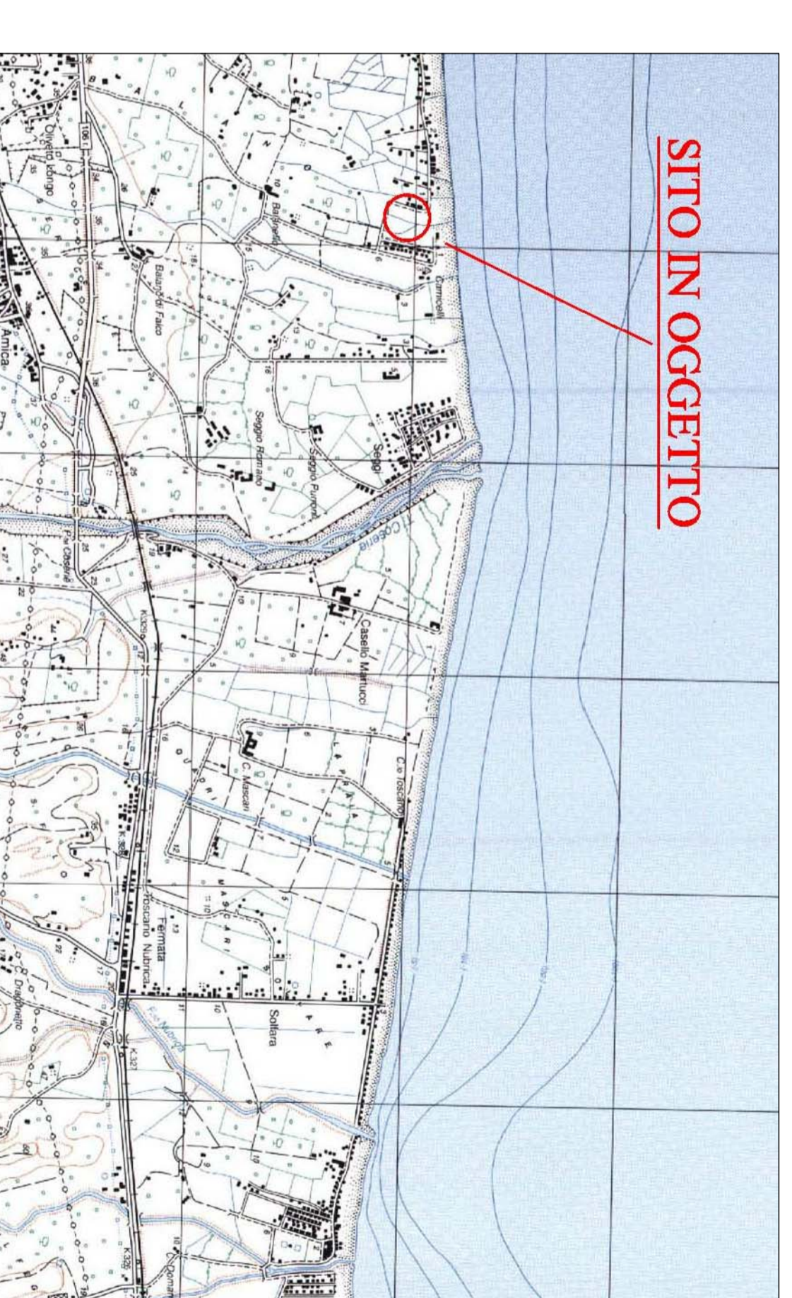
COROGRAFIA - SCALA 1 : 25.000