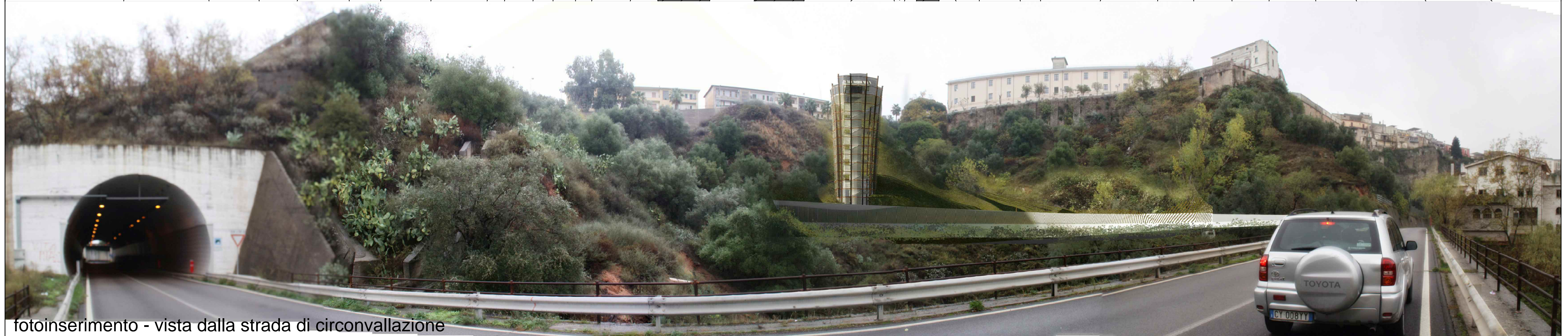
fotoinserimento - vista dalla strada di circconvallazione

Sede R.T.P. Via dei Principati n. 57 - 84122 - Salerno tel. 089.239904 - fax 089.239400 - e-mail giudicem@tin.it - www.studiotecnicojudice.com