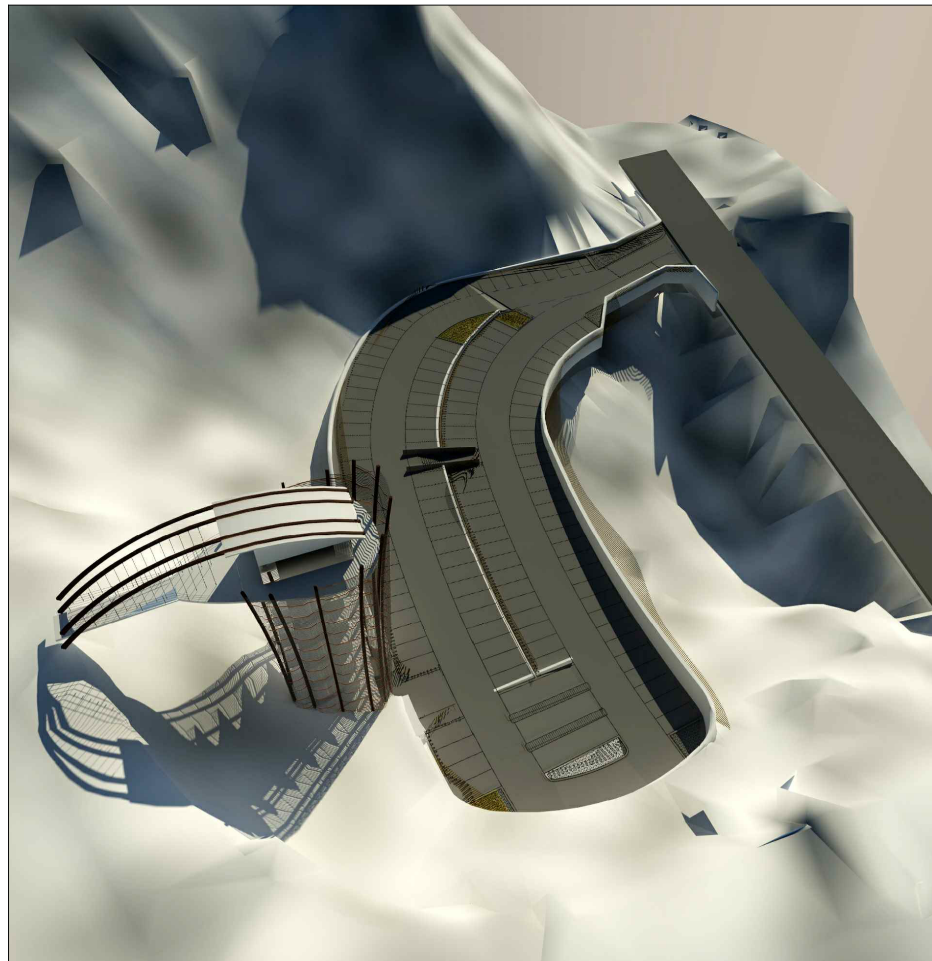
planimetria generale area di aprcheggio