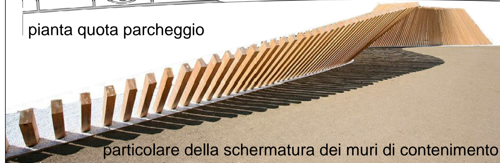
particolare della schermatura dei muri di contenimento