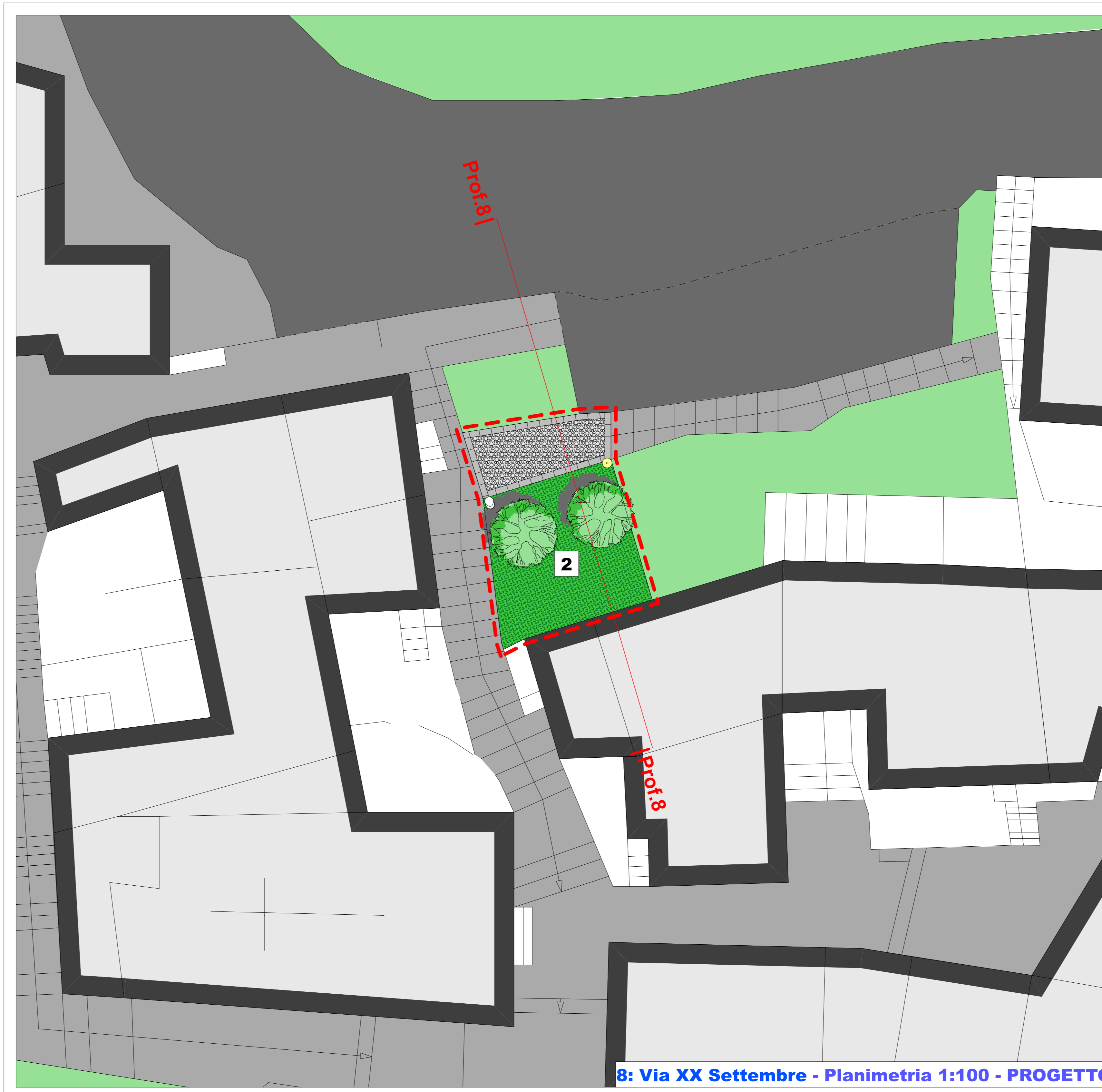
8: Via XX Settembre - Planimetria 1:100 - PROGETTO